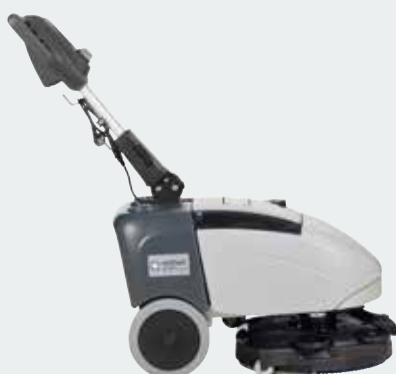
Tableau de commandes avec trois modes opératoires pour une facilité d'utilisation