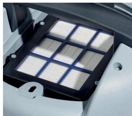
Un niveau de filtration supérieur grâce au filtre d'échappement HEPA