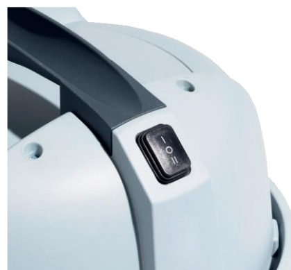
Une double vitesse pour un usage sur-mesure dans une grande variété d'applications