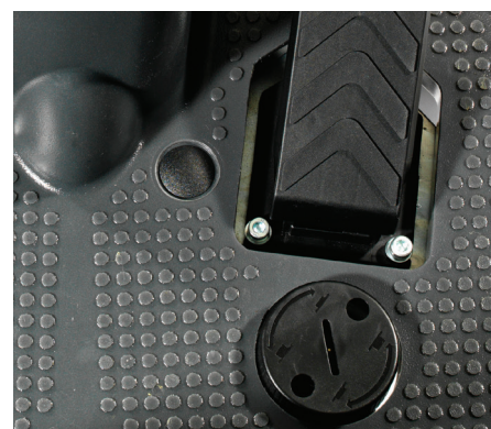
Nouvelle pédale avec système de talon réglable pour éliminer toute tension au niveau du pied de l'opérateur

L'exceptionnel système Ecoflex permet à l'opérateur d'interrompre le mode de nettoyage économique et d'augmenter la puissance pendant une minute en activant la touche d'intensification. Quand l'efficacité et l'écologie ne font qu'un !