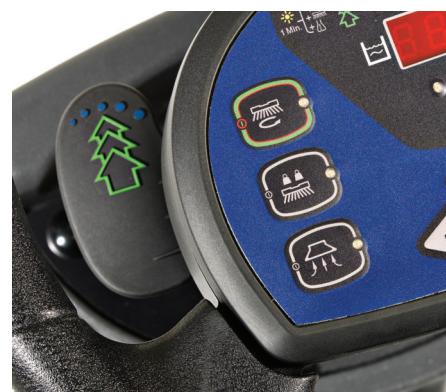
Une palette permet d'activer et de désactiver le système Ecoflex